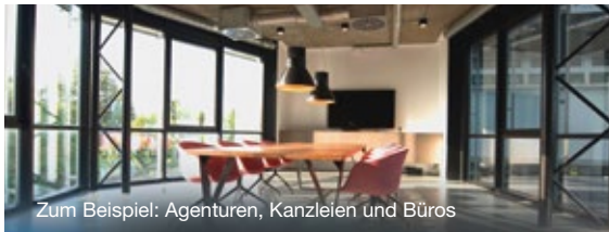
Zum Beispiel: Agenturen, Kanzleien und Büros