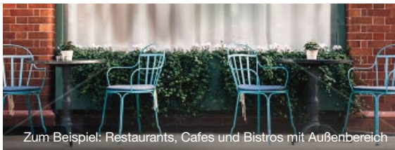
Zum Beispiel: Restaurants, Cafes und Bistros mit Außenbereich