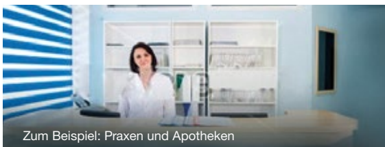
Zum Beispiel: Praxen und Apotheken