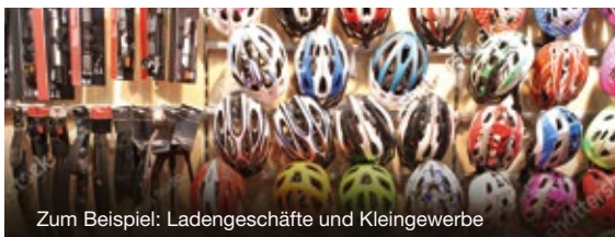
Zum Beispiel: Ladengeschäfte und Kleingewerbe