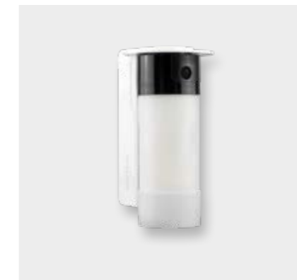
Funk-Außenbewegungsmelder mit Kamera, Sprache, Orientierungsleuchte SH156AX Tierimmun Außen

Maße (HxBxT): 176 x 53 x 67 mm Anwendungsgebiete: Zur Einbruch-Absicherung von Fenstern, Türen und Garagentoren Anbringung: Direkt an der Fassade / Hauswand Reichweite: 3 bis 8 Meter Erfassungsbereich: 90 Grad schwenkbar (manuell) Montagehöhe: 0,8 - 1,2 Meter Detektion: Wenn beide Infrarot-Strahlen durchbrochen werden Sabotageschutz: Löst aus, wenn der Melder abgedeckt wird Tierimmun: Keine Detektion z. B. durch kleine Tiere im Garten