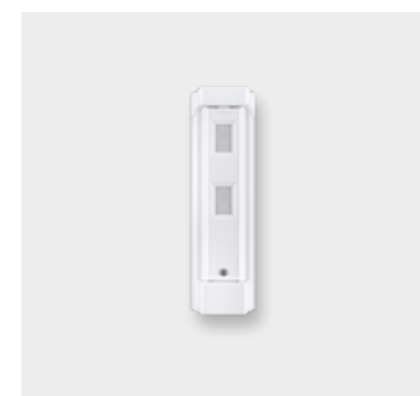
Funk-IR-Bewegungsmelder SH148AX Außen

Maße (HxBxT): 198 x 148 x 92 mm Anwendungsgebiete: Zur Absicherung von privaten oder gewerblichen Grundstücken, flächendeckende Abwehr Anbringung: z. B. an der Hauswand Reichweite: 4 bis 12 Meter Erfassungsbereich: 85 Grad Montagehöhe: 2,5 bis 3 Meter Detektion: Wenn beide Infrarot-Strahlen durchbrochen werden Sabotageschutz: Löst aus, wenn Melder abgedeckt wird Tierimmun: Keine Detektion z. B. durch kleine Tiere im Garten