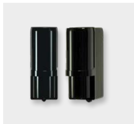
Lichtschranke SH102AX 30 m | SH103AX 60 m

Maße (HxBxT): 200 x 160 x 80 mm Anwendungsgebiete: Funk-Infrarot-Lichtschranke für Privat-/ Gewerbeobjekte, zum Schutz der äußeren Sicherheitsbereiche, Grundstücksgrenze / Gartenzaun, äußerste fallenmäßige Abwehr Anbringung: z. B. an Wand oder Pfosten Reichweite: je nach Modell 30 bzw. 60 Meter Erfassungsbereich: 90 Grad horizontal / 5 Grad vertikal Montagehöhe: 0,70 - 1,00 Meter Detektion: Wenn Strahlenbündel durchbrochen werden (1 Strahl = 2 Strahlenbündel) Sabotageschutz: Löst aus, wenn ein Sender oder Empfänger sabotiert (abgerissen o.ä.) wird Tierimmun: Keine Detektion z. B. durch kleine Tiere im Garten