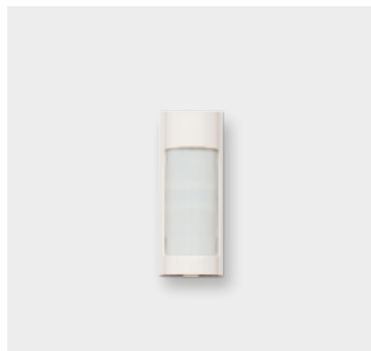
Funk-IR-Bewegungsmelder SH144AX Außen

Maße (HxBxT): 200 x 160 x 80 mm Anwendungsgebiete: Funk-Infrarot-Lichtschranke für Privat-/ Gewerbeobjekte, zum Schutz der äußeren Sicherheitsbereiche, Grundstücksgrenze / Gartenzaun, äußerste fallenmäßige Abwehr Anbringung: z. B. an Wand oder Pfosten Reichweite: je nach Modell 30 bzw. 60 Meter Erfassungsbereich: 90 Grad horizontal / 5 Grad vertikal Montagehöhe: 0,70 - 1,00 Meter Detektion: Wenn Strahlenbündel durchbrochen werden (1 Strahl = 2 Strahlenbündel) Sabotageschutz: Löst aus, wenn ein Sender oder Empfänger sabotiert (abgerissen o.ä.) wird Tierimmun: Keine Detektion z. B. durch kleine Tiere im Garten