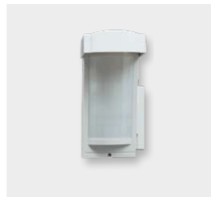
Funk-IR-Bewegungsmelder SH146AX Tierimmun Außen

Maße (HxBxT): 108 x 71 x 106 mm Anwendungsgebiete: Zur Absicherung von privaten oder gewerblichen Grundstücken, flächendeckende Abwehr Anbringung: z. B. an Mauern, Säulen etc. Reichweite: 2,5 bis 12 Meter Erfassungsbereich: 90 Grad Montagehöhe: 0,8 bis 1,2 Meter Detektion: Wenn beide Infrarot-Strahlen durchbrochen werden Sabotageschutz: Löst aus, wenn Melder abgedeckt wird Tierimmun: Keine Detektion z. B. durch kleine Tiere im Garten